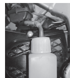
燃料キャッチタンク