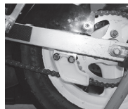
リアスプロケットガード

その他、車検長が、危険または著しく不正と判断した車両は、出走停止・不適合・改善指示の判断をする。その決定に対して、異議を申し立てることは認められない。